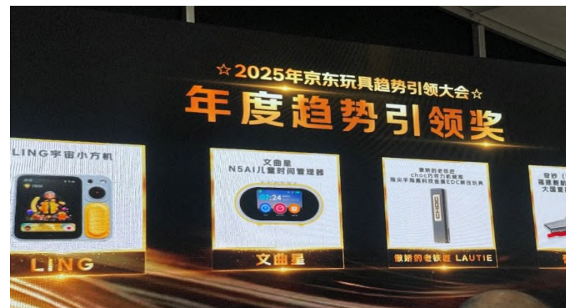
AI早教時間管理器獲得2025年度京東年度玩具趨勢引領獎